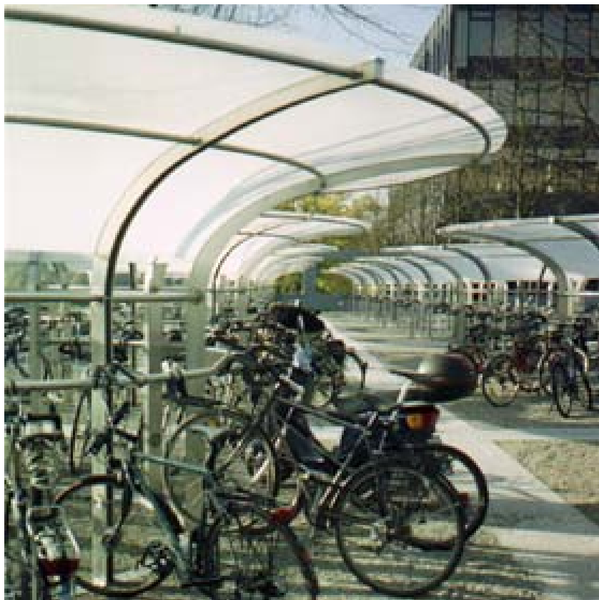
ETH Hönggerberg, Zürich

Auswertung: Oktober 2002 / Verena de Baan