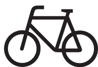
Signal 5.31 Cycle

Des rehaussements même légers ou des rigoles ont un effet sur le comportement des cyclistes. Ces deux types d'aménagement peuvent être employés par exemple pour marquer la transition entre une surface mixte et une surface réservée aux piétons. Cependant, les aménagements doivent dans tous les cas être adaptés aux besoins des personnes handicapées. Des éléments de mobilier urbain et des éléments tels que des bancs et des luminaires peuvent aussi être exploités pour contribuer au bon fonctionnement des surfaces communes.